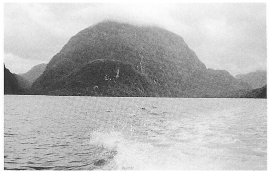
図2——細い水道の横にそびえる絶壁の岩山。このような氷蝕の地形は水道の周りには至るところに見られる。

2月13日。雨はまだ降っている。朝のうち海岸に上がりサンプリング。が雨のためクリノメーターの文字盤が濡れて見えず測定が荒っぽくなる。伊藤隆は彼の仕事のひとつである苔集めを熱心にやっている。午後、やっと天気は回復に向かったので出発。オレジャ島とエスメラルダ島の間を細く南へ走るソトマヨル水道を南下する。神父はつねに高度計を懐中に入れていて時々気圧を調べている。昨夜は1000ミリバール近くまで下がった気圧も徐々に上がり出した。1時過ぎ、広いラドリジェーロ水道に出る。16世紀の探検者ファン・ラドリジェーロにちなんだ水道だ。この水道は北のファヨス水道のつぎになっている。このあたりの山なみは平均600~700mでゆったりと