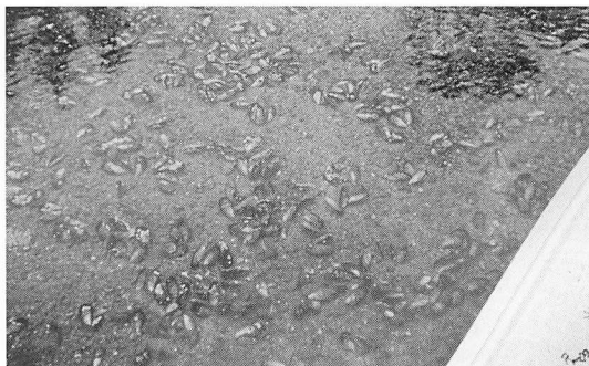
図8—浅い水辺に生息するたくさんのチョルガ(ムール貝の一種)。

トリプレ・フィヨルドを出てファヨス水道を北上する。午後5時、ウェリントン島の北西角にあるドン・ホセ・フィヨルドに入り、入口は狭く中が広くなった静かな入江に入る(図7)。停泊することにした浜辺はチョルガが非常に多い(図8)。夕方は引き潮でまるで海岸にころがる石ころのように一面にでてくる。林を切り開いてたき火する場所をつくる。砂浜は満潮になればなくなってしまふ。砂浜というより小石の浜と呼ぶのがふさわしい。一般にフィヨルド地帯の海岸は細かい砂は余り見かけない。ひとつには、川による浸蝕、堆積がないこと、もうひとつは波があまりないことによるのだろう。レヴィカンはテプーの木でうまく鍋をかける工夫をする。テプーはたき火には一番いい木で、細い枯れたものはたきつけにも使える。