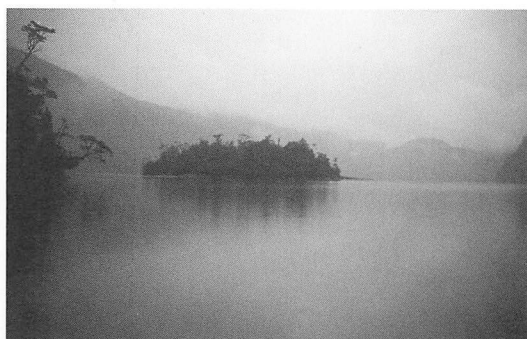
図6——コイウエ(南極ブナ)に覆われた小島のあるトリプレ・フィヨルドの奥。

さっそくレヴィカンはロボの尾を持ってボートのへ先にほうり上げる。1頭上げるごとにボートに手をかけてハァーハァーと激しい息づかいをす