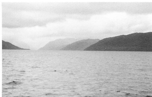
図3——「中庭」の周りの景観。迷路のような水道の周りには幾重にも山が連なっている。