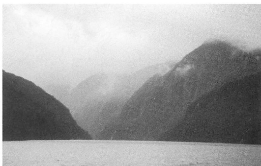
図4——ウェリントン島に奥深く入り込んだトリプレ・フィヨルドの入り口付近の景観。狭い水路の両側に急峻な地形が迫る。

どんづまりは平坦な地形でコイウエの原始林がびっしりおおっている。両側の急しゅんな岩肌をぬって平坦地はさらに奥へと続き、湖のあることを予想させた。ここから島の東岸にあるエデンまでは15kmしか離れていない。ここでおりてエデンまで島を横断する試みは、下の原始林帯は非常に苦労するだろうが、稜線に出れば楽しいので