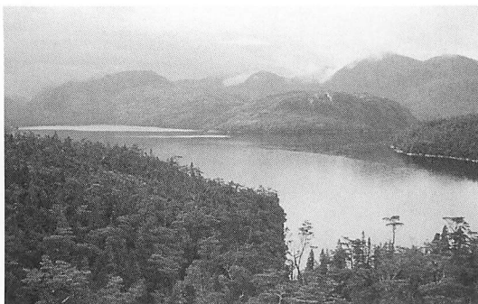
図7—静かなドン・ホセ・フィヨルド。周りはコイウエがびっしりと生えている。

くたちの居場所がなくなってきた。満潮になると海水はちょっとした砂礫の浜をなくし、森林のやぶまで入ってくる。ほんの少し水面に出た岩にやっと2人乗ってボートを待つ。