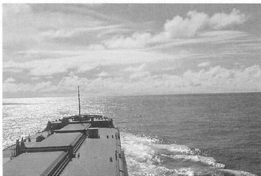
太平洋を横断して、一路南米に向かう鉄鉱石運搬船八洲川丸。

翌朝、ゆったりとしたローリングのなかで目を覚した。ブリッジに上がってみると、もう一面、緑色の大海原だ。船は遠州沖を東に向かって走っていた(写真)。